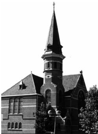
Noorderkerk, Amsterdamseweg 9 http://ede.protestantsekerk.net